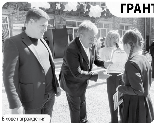
В ходе награждения