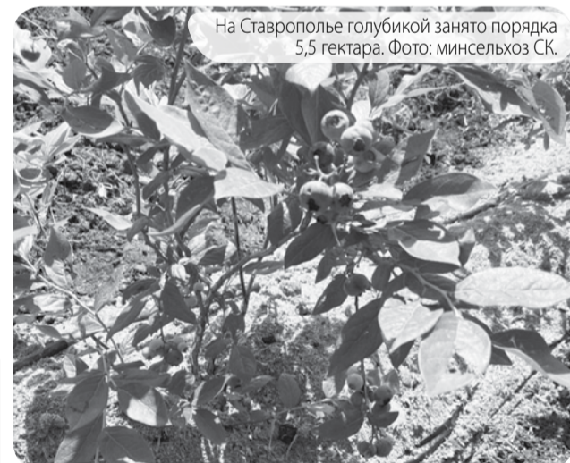
На Ставрополье голубикой занято порядка 5,5 гектара.

На Ставрополье ягоду северных широт начали выращивать в промышленных масштабах. В настоящее время в крае уже высажено два гектара голубики, ещё столько же было заложено в прошлом году.